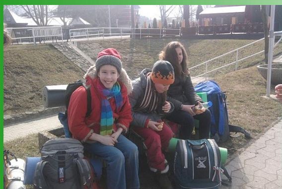
Kolibri órs a téli portyán