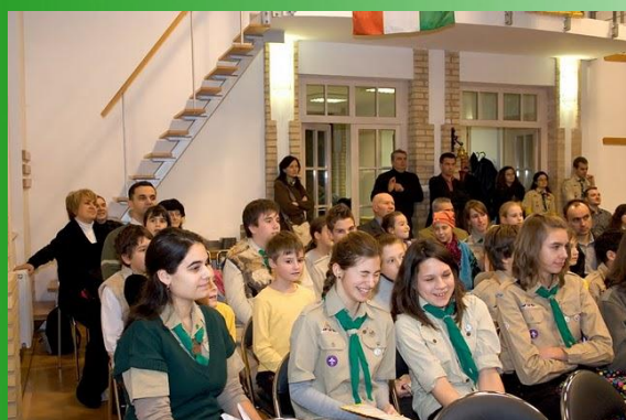
Fehér farkas órs a Csapatkarácsonyon