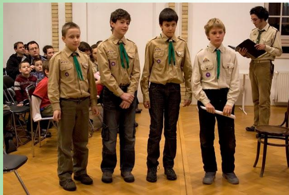
Puma órs a Csapatkarácsonyon