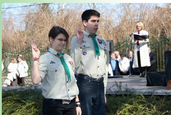
Koszorúzás március 15-én (Zsömby, Balu)